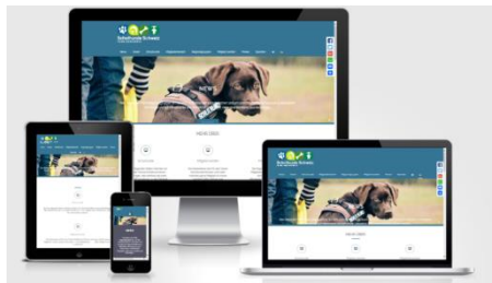
Der neue Web-Auftritt des VSHS

Ganz unerwartet hatte eine kürzlich vorgenommene, kleine Aktualisierung unseres Webdesigns unsere ganze Webseite über den Haufen geworfen.