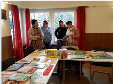
Medienkisten des VSHS

In Zukunft wird Corinne neben ihren anderen Vorstandsaufgaben die Finanzen und die Vereinsartikel betreuen.