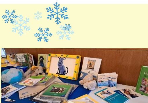
Materialtisch an der OV